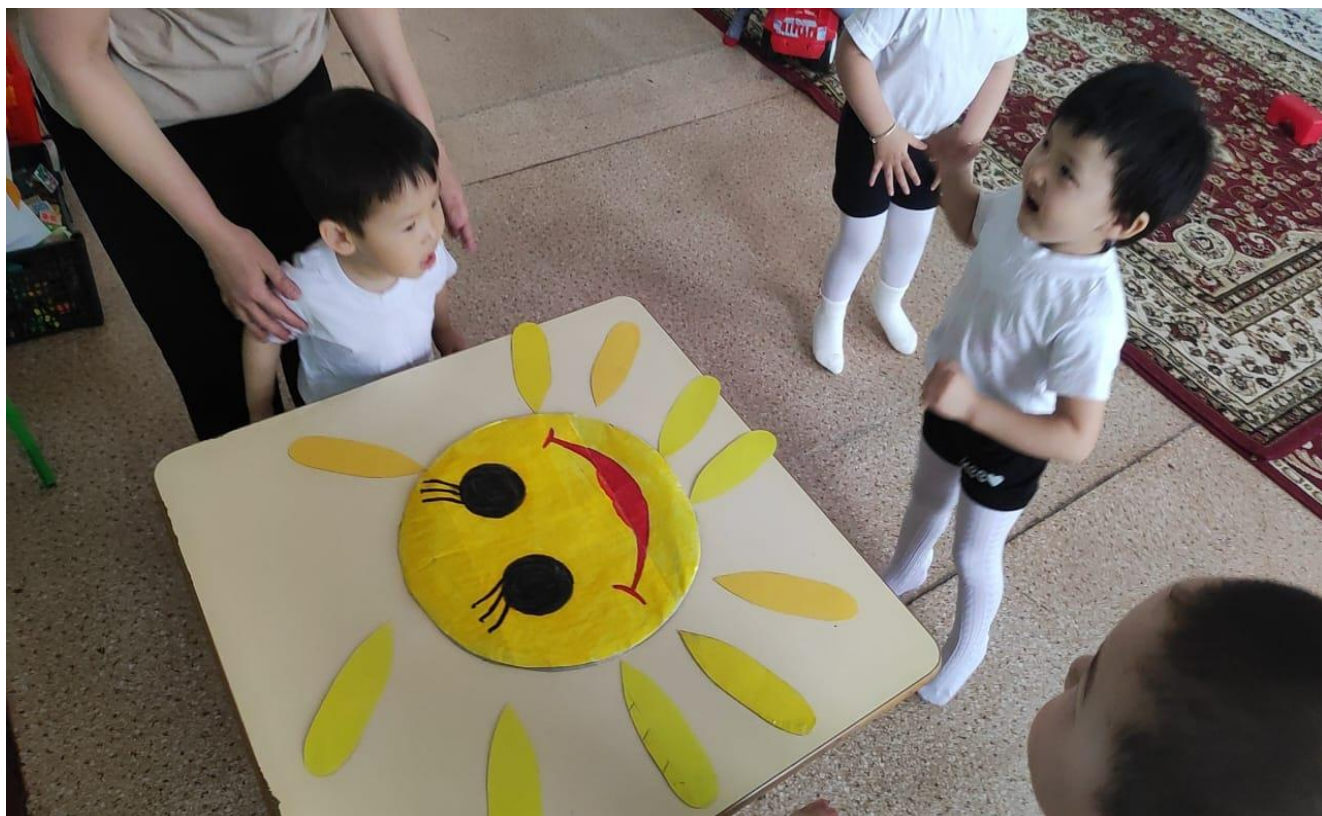
«Айналайын» тобы ашық сабақ. Тақырыбы: Ойнайықта, ойлайық!