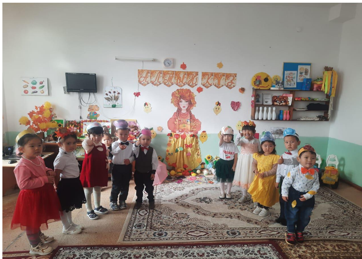
«Алтын күз» ертеңгілігі

Екі аяқпен жүремін Екі көзбен көремін, Екі қолым бар менің Екі құлақты білемін. Осы кесте бойынша балалар тақпақ жаттайды.